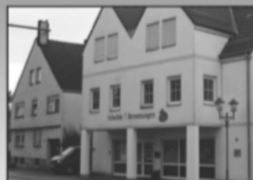
Hindenburgstraße 39 89129 Langenau Tel: 07345/21792

Wir sind Tag und Nacht für Sie erreichbar! www.scheible-bestattungen.de