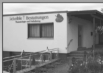
Blumenstraße 16 89183 Holz Kirch Tel: 07340/9697-0